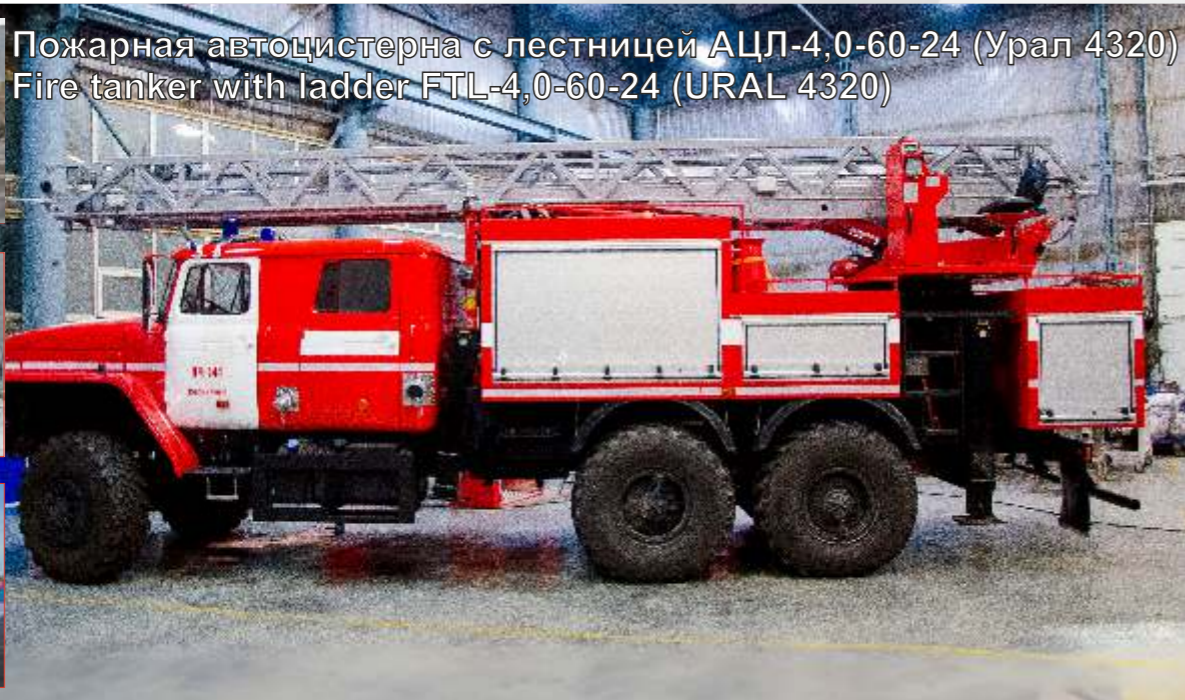
Пожарная автоцистерна с лестницей АЦЛ-4,0-60-24 (Урал 4320) Fire tanker with ladder FTL-4,0-60-24 (URAL 4320)