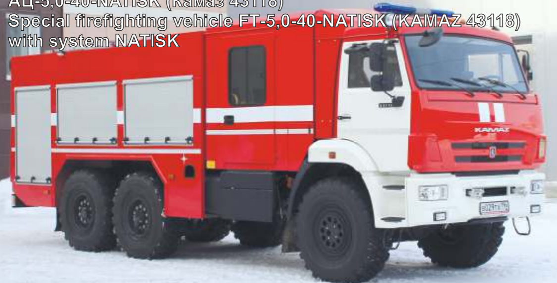
Пожарная автоцистерна с системой NATISK АЦ-5,0-40-NATISK (Камаз 43118) Special firefighting vehicle FT-5,0-40-NATISK (KAMAZ 43118) with system NATISK