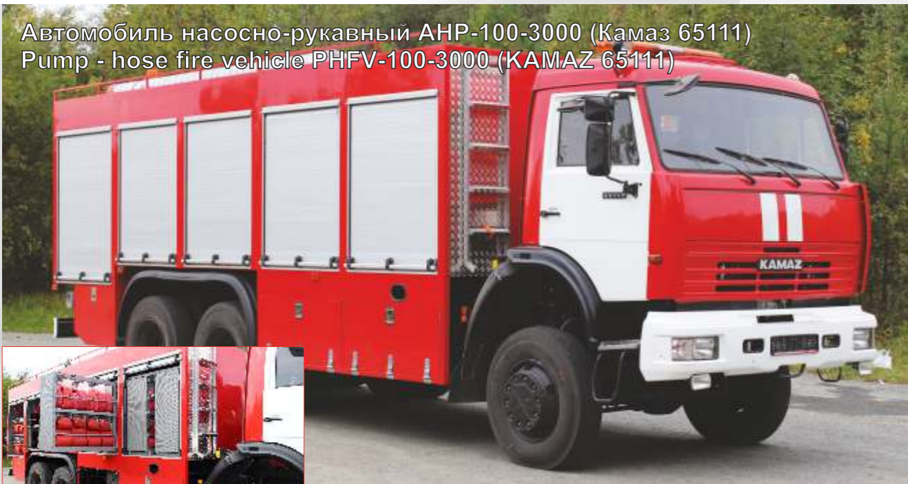
Автомобиль насосно-рукавный АНР-100-3000 (Камаз 65111) Pump - hose fire vehicle PHFV-100-3000 (KAMAZ 65111)