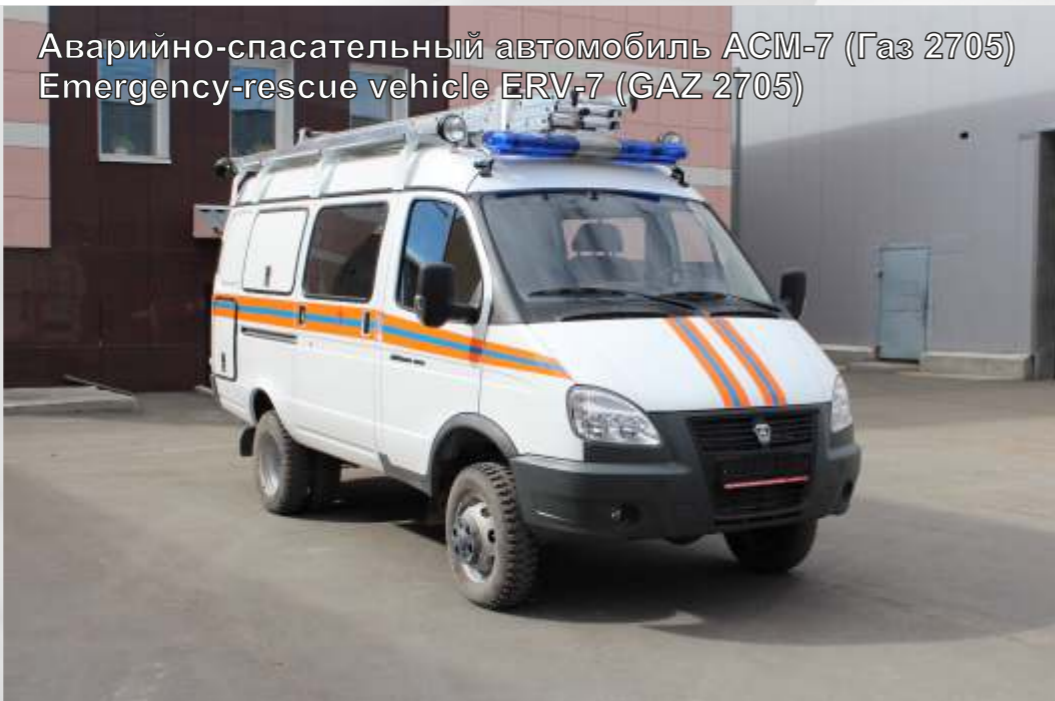
Аварийно-спасательный автомобиль АСМ-7 (Газ 2705) Emergency-rescue vehicle ERV-7 (GAZ 2705)